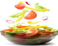
¡Energízate con el desayuno!